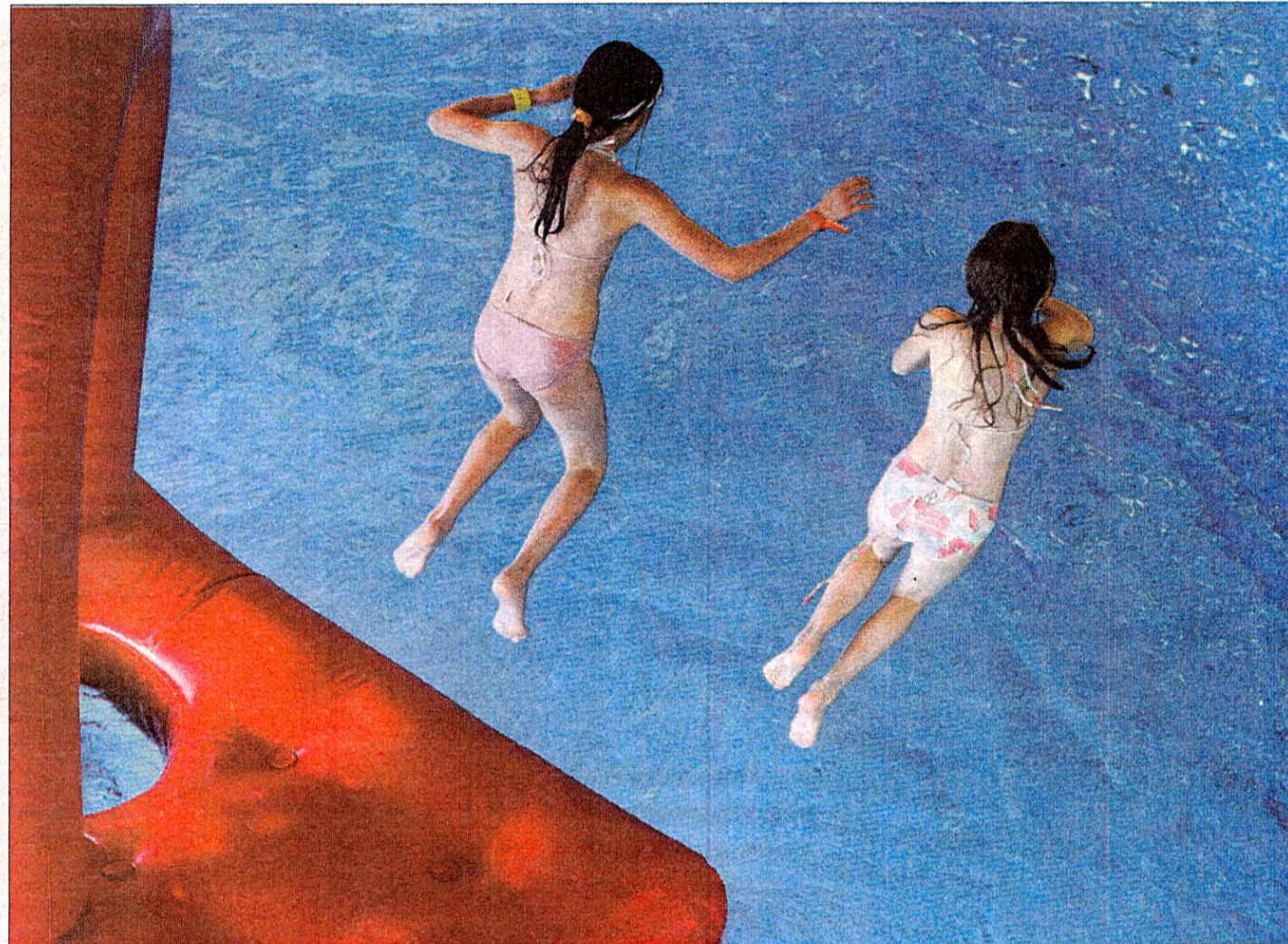
Ein Sprung ins Wasser erfordert außer Mut Übung und Vertrauen. Viele Viertklässler haben das nicht.